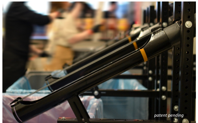
De geretourneerde bekertjes worden netjes samengevoegd in de hiertoe ontwikkelde collectiebuizen.

STAR illustreert hoe creatieve technische oplossingen praktische uitdagingen kunnen oplossen terwijl duurzaamheid en efficiëntie worden gewaarborgd.