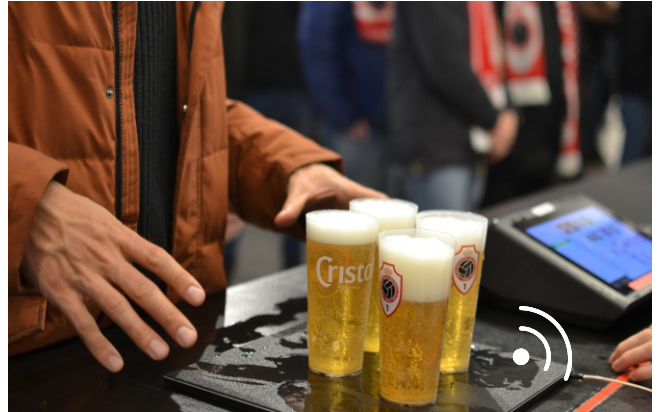
De RFID-tags van de bekertjes worden gelezen aan het Point of Sale