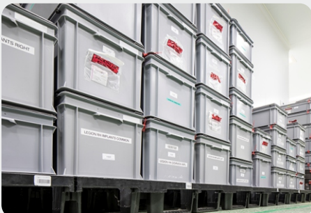
Plastic kisten met implantatensets.