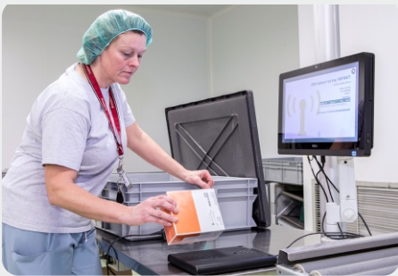
Een desktop lezer leest de informatie die zich op de tag bevindt. De Aucxis Hertz middleware transformeert de gegevens naar een formaat leesbaar voor het ERP-pakket van Sterima.