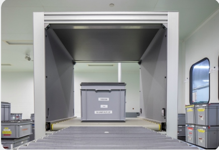
RFID-tunnel geïntegreerd in rolbandstelsel: enkel de tags die doorheen de tunnel passeren worden gedetecteerd.