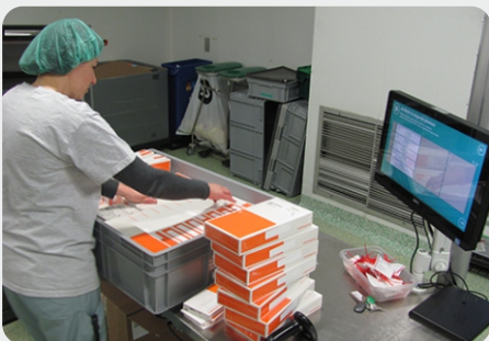
Elk doosje uit de implantaten leenset wordt voorzien van een RFID-label. In de RFID-tunnel wordt de aanwezigheid resp. afwezigheid van elke doos foutloos gedetecteerd.