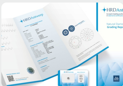
Diamond certificate set in plastic envelope